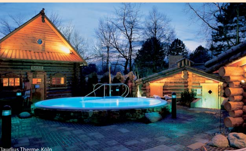
Claudius Therme, Köln

Gültig ab April 2009 auf Anfrage und Verfügbarkeit. Kinderermäßigung auf Anfrage! Dieses Angebot gilt nicht während Messe- und Eventzeiten. Alle Preise verstehen sich pro Arrangement und beinhalten Service sowie die gesetzliche Mehrwertsteuer. Preisänderungen vorbehalten.